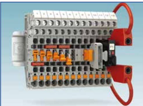
Phoenix Contact www.phoenixcontact.com/it