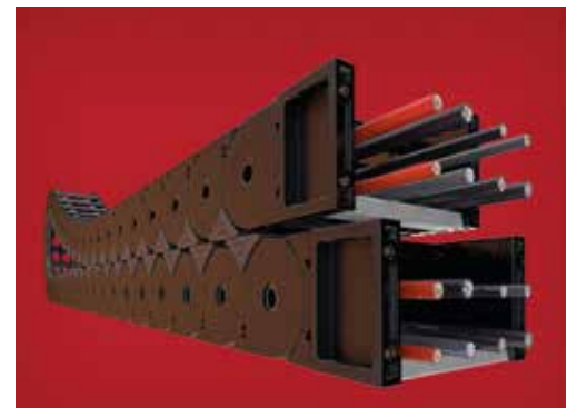
Tsubaki Kabelschlepp www.kabelschlepp.de