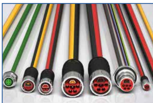
Beckhoff Automation www.beckhoff.it

Leggi la versione completa dell'articolo