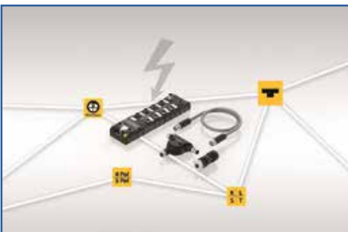
Turck Banner www.turckbanner.it