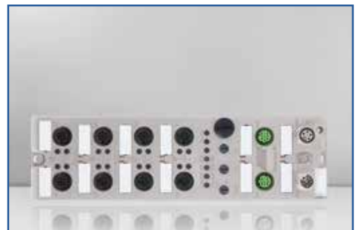
wenglor sensoric www.wenglor.com